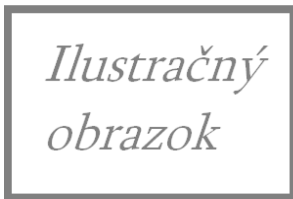
Obr. 2.2: Popis obrázku s mensim fontom popisu keď mám príliš dlhý popis veľký ako odsek a už by sa to malo so zvýšeným textom tak nech to odliším že je to popis

vložený väčší vertikálny priestor medzi obrázkami