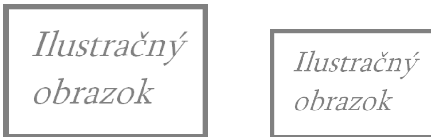
Obr. 2.1: Dva obrázky so spoločným popisom a vloženou horizontálnou medzerou medzi obr